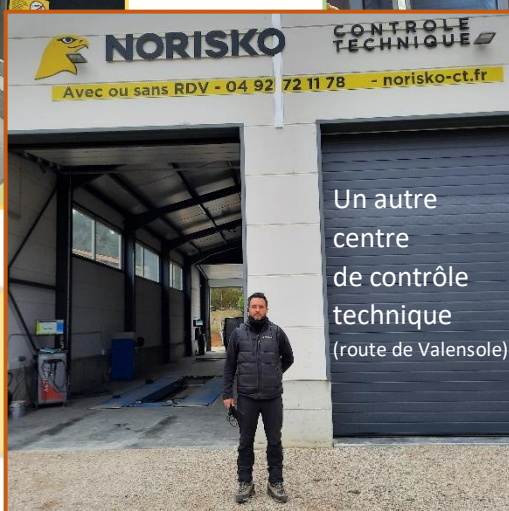
Un autre centre de contrôle technique (route de Valensole)