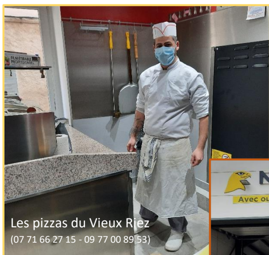
Les pizzas du Vieux Riez (07 71 66 27 15 - 09 77 00 89 53)