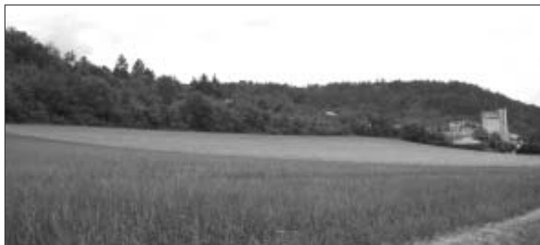
Le futur emplacement du lotissement au Chemin de la Rougrière.

soulever et l'égout se déverser dans les propriétés et même dans les habitations avec tout ce que cela comporte comme désagréables nuisances. La canalisation existante a été doublée par une nouvelle conduite sous le chemin des