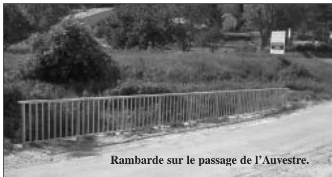
Rambarde sur le passage de l'Auvestre.

soulever et l'égout se déverser dans les propriétés et même dans les habitations avec tout ce que cela comporte comme désagréables nuisances. La canalisation existante a été doublée par une nouvelle conduite sous le chemin des