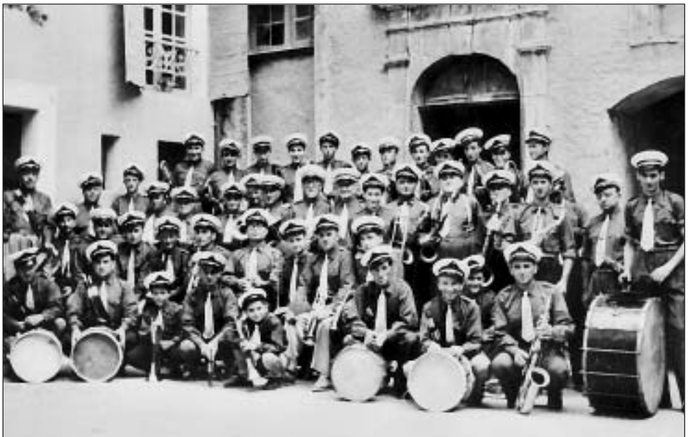
Sur la place de la mairie, ils ont fière allure nos anciens musiciens... en reconnaissez-vous ?