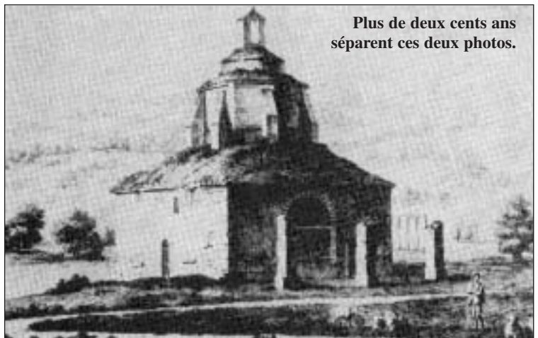
Plus de deux cents ans séparent ces deux photos.