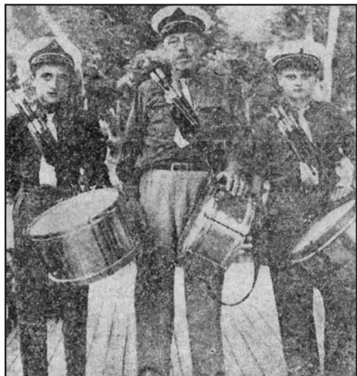
Le chef-tambour et deux de ses élèves.

pour l'hiver et les cérémonies funèbres, recouvertes d'une toile blanche pour le printemps et l'été, de cravates (rouge grenat sur une chemise bleu marine ! Quel effet !), de fanions pour les tambours et clairons.