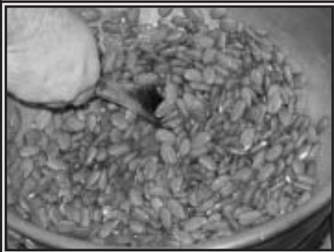
Fabrication du nougat