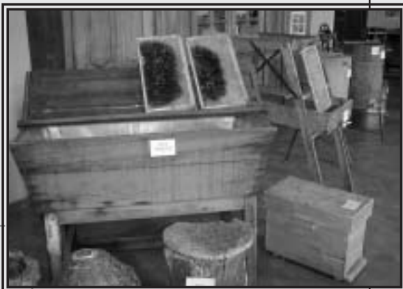
Exposition de matériel ancien

Les restaurants proposaient leur repas au miel. Il fut difficile de déjeuner sans une réservation préalable.