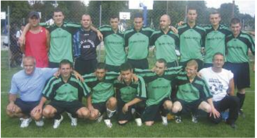
- l'équipe première en promotion d'honneur A

Nos deux équipes attaquent le championnat :