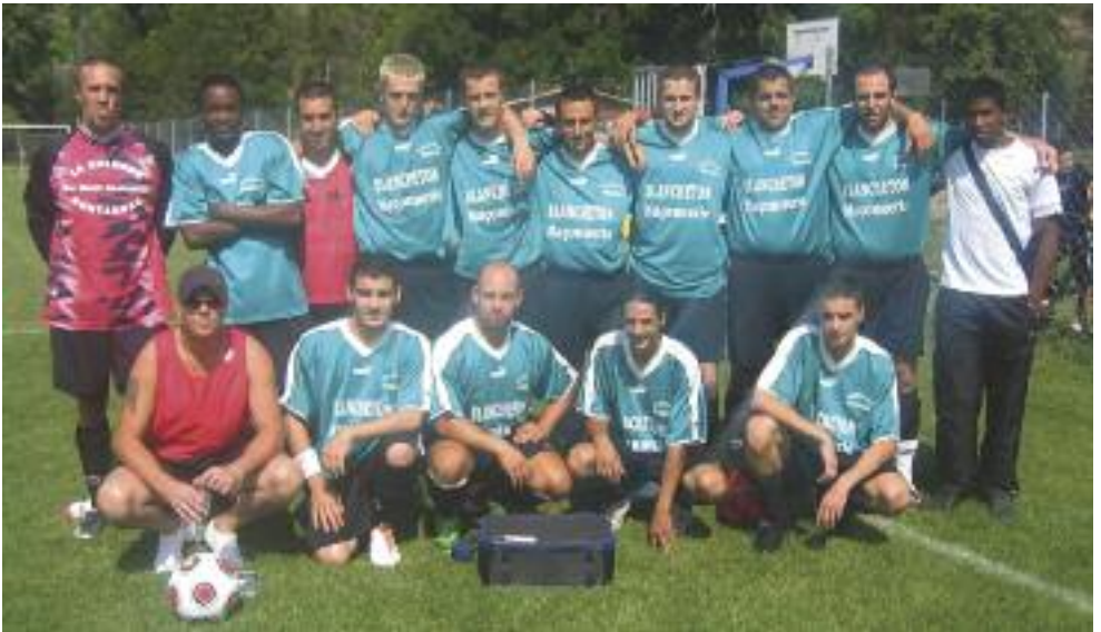
- la réserve en première division

Il faut que nos équipes tiennent leur place et terminent cette saison la tête haute : courage et abnégation,