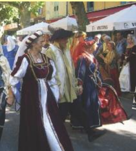
et le peuple expriment leur joie