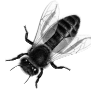
Les Varestrels, conteur de Provence.