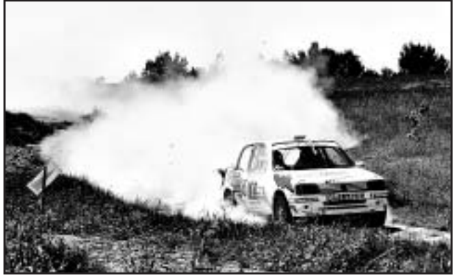
Didier Cottineau, photographe à Riez