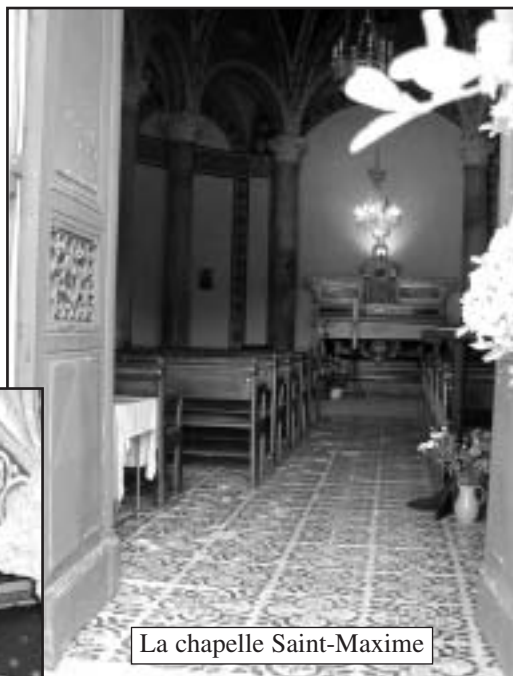
La chapelle Saint-Maxime

• La chapelle Saint-Maxime, elle aussi doit subir une réfection. Le toit n'est plus étanche, le ciel au-des-