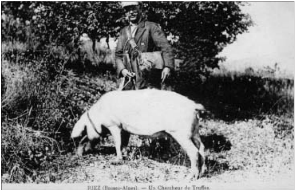
RIEZ (Haute-Alpes) — Un Chasseur de Truffes.

Janvier avec son cortège de grisaille, de gel et de givre nous amène aussi des jours qui rallongent annonçant un peu le printemps. C'est le mois des attentes, c'est le mois des vœux, donc aussi de l'espoir. Espoir d'une vie, d'un futur et d'un monde meilleur. Par conséquent, au seuil de cette nouvelle année, je voudrais, au nom du Conseil Municipal de Riez, vous souhaiter de tout cœur une bonne et heureuse année pour vous, vos proches et vos amis.