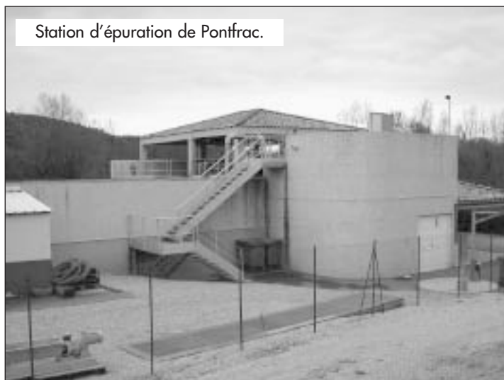
Station d'épuration de Pontfrac.

Actuellement aucune liaison ne relie les deux bassins. Si d'aventure le bassin du cimetière n'était plus alimenté en raison d'une défaillance de la nappe phréatique de l'Auvergne ou de problèmes techniques, une partie du village serait privée d'eau sans que l'on puisse la relier sur l'autre bassin. Des travaux vont être réalisés en début d'année pour faire communiquer les deux bassins et résoudre ce problème important pour le village.