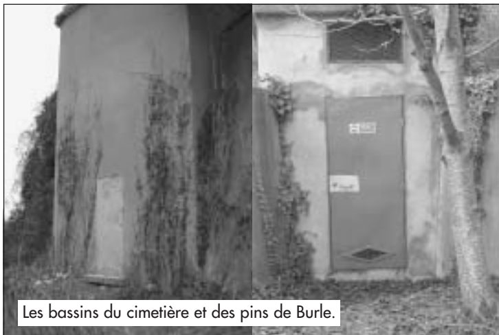
Les bassins du cimetière et des pins de Burle.

trouve aux Pins de Burle (pins situés sur le coteau à peu près face au collège) et reçoit pour une partie l'eau de la source de la Colonne qui est pompée jusqu'au bas-